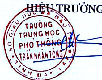
Trương Công Hữu